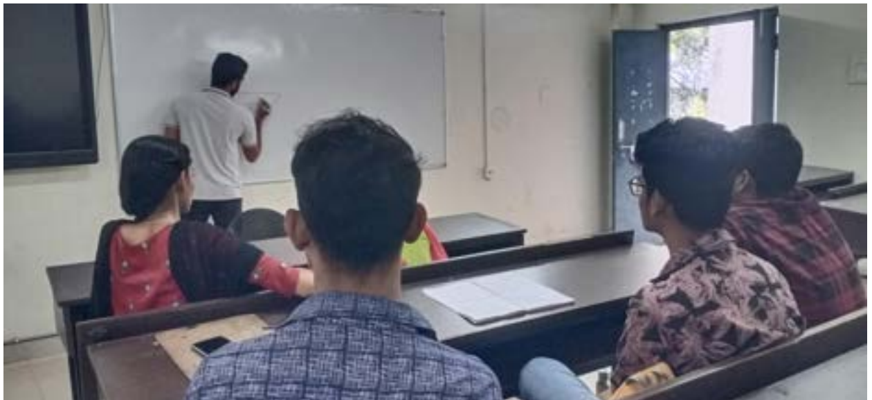
SUPPORTING "LIBRARY MOVEMENT"