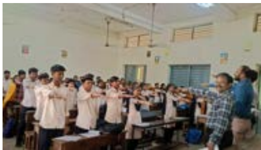
BEST PRACTICE- NEWLY RELEASED BOOK PRESENTATION